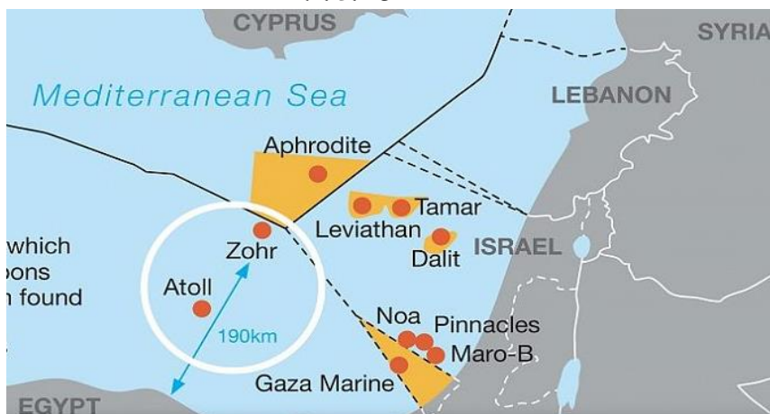
شکل ۲. میدان گازی زهر

سرمایه‌گذاری‌های امارات با جهشی فوق‌العاده به ۶,۶ میلیارد دلار در سال ۲۰۱۸ و ۷,۲ میلیارد دلار در سال ۲۰۱۹ رسید. در جریان دیدار ۱۶ نوامبر ۲۰۱۹، السیسی از امارات و دیدار با محمد بن زاید، طرفین در خصوص سرمایه‌گذاری مشترک ۲۰ میلیارد دلاری در پروژه‌های اقتصادی و اجتماعی توافق نمودند. در مارس ۲۰۱۸ نیز شرکت مبادله پترولیوم ۱۰ درصد از امتیاز میدان عظیم گازی "زهر" در مدیترانه را با مبلغ ۹۳۴ میلیون دلار به دست آورد (بزرگترین میدان گازی مدیترانه با بیش از ۳۰ تریلیون فوت مکعب ذخایر گازی) (Megahid, 2018).