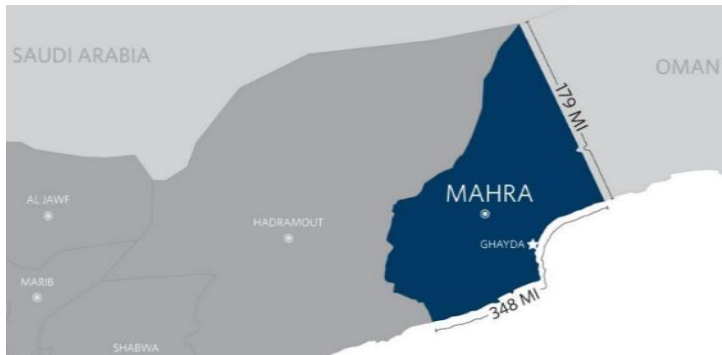
شکل ۵. موقعیت استراتژیک استان المهره یمن

تحركات ابوظبی، سلطان‌نشین عمان تلاش نموده تا با بهره‌گیری از پیوندهای قبیله‌ای و فرهنگی اهالی این منطقه با منطقه ظفار عمان، به آنها تابعیت مضاعف اعطا نماید. افزون بر این، تلاش نموده شورای نجات ملی جنوب ۱ را به‌عنوان اهرمی در برابر شورای انتقالی جنوب مورد حمایت اماراتی‌ها مطرح کند.