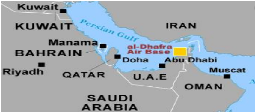
شکل ۱. موقعیت جغرافیایی پایگاه هوایی الظفره امارات

باید توجه داشت که دیدگاه ابوظبی و محمد بن زاید در قبال کابینه‌های آمریکا متفاوت بوده است. به عنوان مثال، ابوظبی در جولای ۲۰۱۵ با این استدلال که برجام مانعی در برابر قدرت و نفوذ فزاینده ایران ایجاد نموده، از انعقاد این توافق استقبال کرد و با این حال، ابوظبی به سرعت رهیافت دولت «اوباما» در قبال ایران را مورد انتقاد قرار داد؛ دولت اوباما را ساده لوح خواند و آن را متهم کرد که قصد دارد کل منطقه را به ایران واگذار نماید. هدف اوباما، ایجاد موازنه میان ایران و مخالفان آن در خلیج فارس بود. در مصاحبه‌ای با آتلانتیک در مارس ۲۰۱۶، وی اعلام کرد سعودی باید خاورمیانه را با دشمنان ایرانی خود شریک شود. عدم حمایت اوباما از متحدان عربی خود که در جریان تحولات انقلابی خاورمیانه و شمال آفریقا به اوج خود رسید، روابط آمریکا و امارات را دستخوش نوسان کرد. این وضعیت با روی کار آمدن دولت «ترامپ» در ژانویه ۲۰۱۷، اتخاذ سیاست فشار حداکثری در قبال ایران و ایفای نقش امارات به عنوان یکی از محورهای سیاست خاورمیانه‌ای آمریکا تعدیل شد. به موجب توافق نامه جدید امنیتی که در می ۲۰۱۷، میان «جیمز متیس» و محمد بن زاید به امضا رسید، آموزش نیروهای مسلح امارات، استقرار ارتش آمریکا در امارات و مانورهای مشترک به توافقات قبلی افزوده شد.