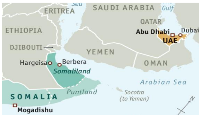
شکل ۳. موقعیت استراتژیک جزایر پانتلند و سومالی‌لند

مالی و سیاسی خود از حکومت فدرال ۱ را قطع کرد. از این زمان به بعد ابوظبی حمایت از مهره‌های دست‌نشانده و مناطق شبه‌خودمختار سومالی‌لند (در سال ۱۹۹۱ به‌طور یک‌جانبه استقلال خود را اعلام کرد) و پانتلند (در سال ۱۹۹۸ استقلال خود را اعلام کرد) و تشکیل دولت موازی را با هدف افزایش فشار بر سومالی در دستورکار قرار داد. دولت شبه‌خودمختار سومالی‌لند در فوریه ۲۰۱۷، موافقت نمود که امارات تأسیسات نظامی خود را در "بربرا" مستقر سازد. این پایگاه که تنها ۹۰ کیلومتر از سواحل یمن فاصله دارد، به نیروهای اماراتی کمک می‌کند محاصره یمن را تکمیل نمایند. منافع منطقه‌ای اتیوپی نیز با موافقت‌نامه بربرا به‌طور قابل توجهی تأمین شده است. بر این مبنای، تضمین یک سومالی تقسیم‌شده و ضعیف به‌مفهوم تبدیل شدن اتیوپی به قدرت بلامنازع محلی است (Cannon, 2017). امارات آموزش ارتش و پلیس سومالی‌لند را نیز به‌عهده دارد. در ازای دریافت امتیاز استقرار پایگاه‌های نظامی، ابوظبی سرمایه‌گذاری در این دو منطقه شبه‌خودمختار را افزایش داد. «دی.پی.ولد» ۲ در سال ۲۰۱۷، قراردادی به ارزش ۳۳۶ میلیون دلار برای توسعه و مدیریت "بندر بوساسو" به امضا رساند. به‌علاوه، این شرکت اماراتی از اکتبر ۲۰۱۸، بیش از ۴۴۲ میلیون دلار برای توسعه بندر بربرای سومالی‌لند سرمایه‌گذاری کرد (Fenton-Harvey, 2020).