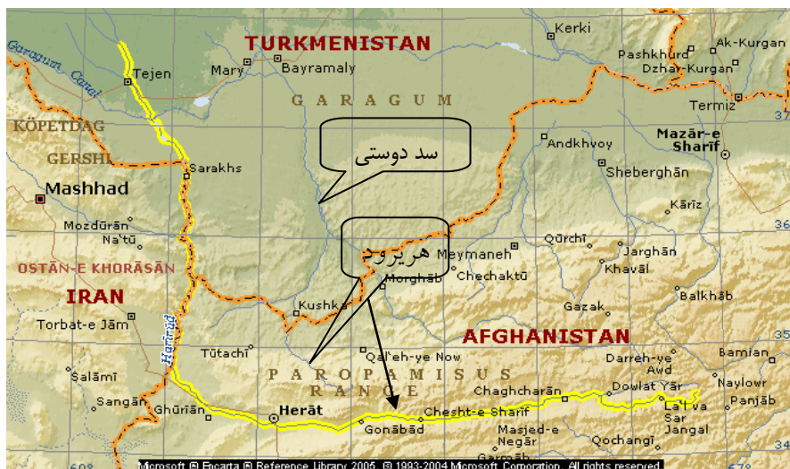
نقشه شماره ۱. موقعیت هریرود و سد دوستی

قره قوم نام چاله‌ای در میان شن‌زارهای ترکمنستان است که آب‌های مناطقی از ایران، افغانستان و ترکمنستان به سوی آن سرازیر می‌شود. قسمتی از جنوب غربی حوضه آبریز قره قوم در شمال شرقی ایران و در مجاورت مرزهای ایران با کشورهای افغانستان و ترکمنستان قرار دارد. به‌طور کلی مساحت حوضه آبریز قره قوم ۱۱۷۲۹۷ کیلومتر مربع برآورد شده که ۴۹۲۶۴ کیلومتر مربع یا ۴۲ درصد آن در افغانستان، ۴۴۵۷۳ کیلومتر مربع یا ۳۸ درصد آن در ایران و ۲۳۴۶۰ کیلومتر مربع یا ۲۰ درصد آن در ترکمنستان واقع است. شکل شماره ۱ سهم هریک از این سه کشور را در حوضه آبریز هریرود نشان می‌دهد.